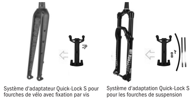
Système d'adaptateur Quick-Lock S pour fourches de vélo avec fixation par vis

Dos du sac lisse sans crochets saillants