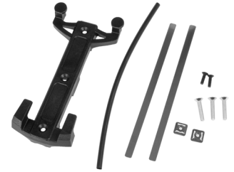
Plaque d'adaptateur Quick-Lock S avec accessoires de montage (inclus dans la livraison)